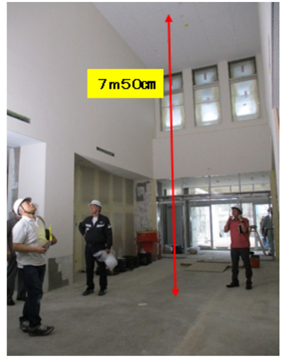
②1階・エントランス（63㎡、19坪）撮影）