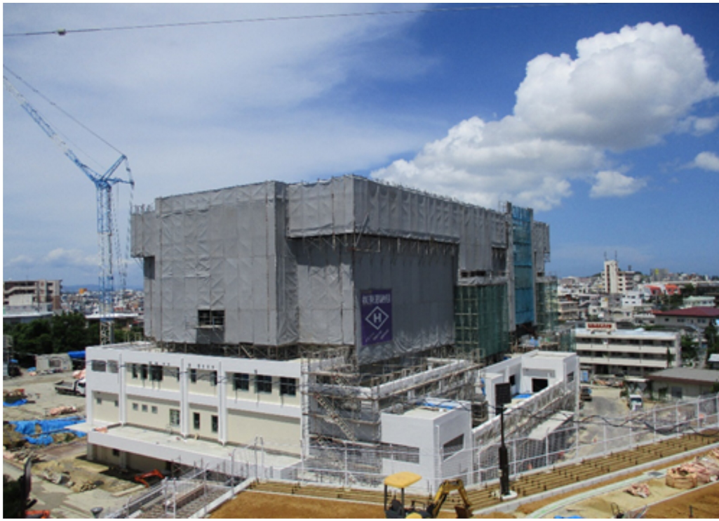
①全体（新吉原公園側から撮影）