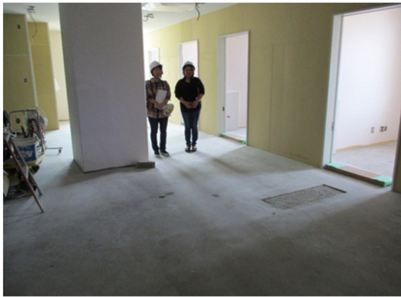
③1階・健診室（206㎡、62坪） 旧健診室（199㎡、60坪）撮影）