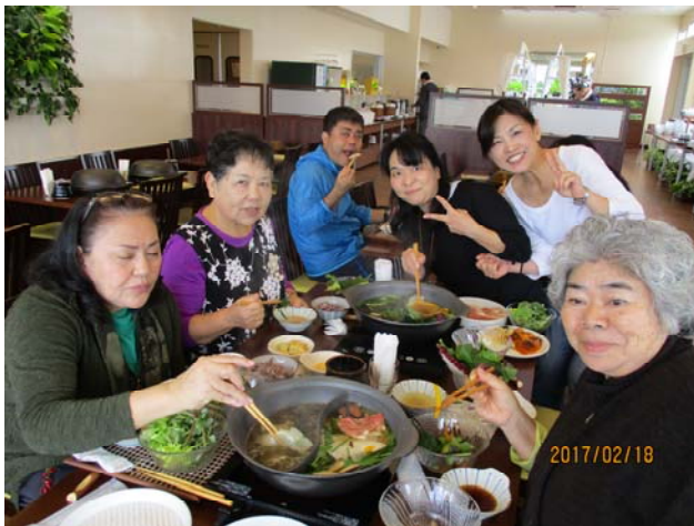
糖尿病患者会(すこやか会)ピクニック