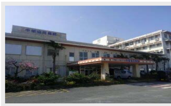
明るく、広々とした移転後の中部協同病院