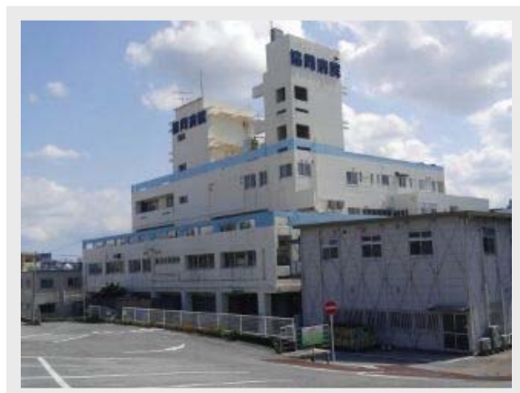
いよいよ解体を控えた旧中部協同病院

また、3月には建設工事を行う大事な業者を選定します。その後は近隣にある吉原公園を移転するための工事、本体工事に入りますが、現在の予定では9月ごろからの工事を予定しています。