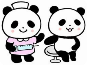
名嘉靖 (kankyokansen.org) 感染管理担当看護師

万一人に5人程度の塩素が変異株に感染すると、約1週間、発熱や咳、喉痛などの症状が現れる。また、変異株は、ワクチンの効果が低下している可能性がある。そのため、引き続き感染予防の徹底が求められる。また、変異株は、ワクチンの効果が低下している可能性がある。そのため、引き続き感染予防の徹底が求められる。