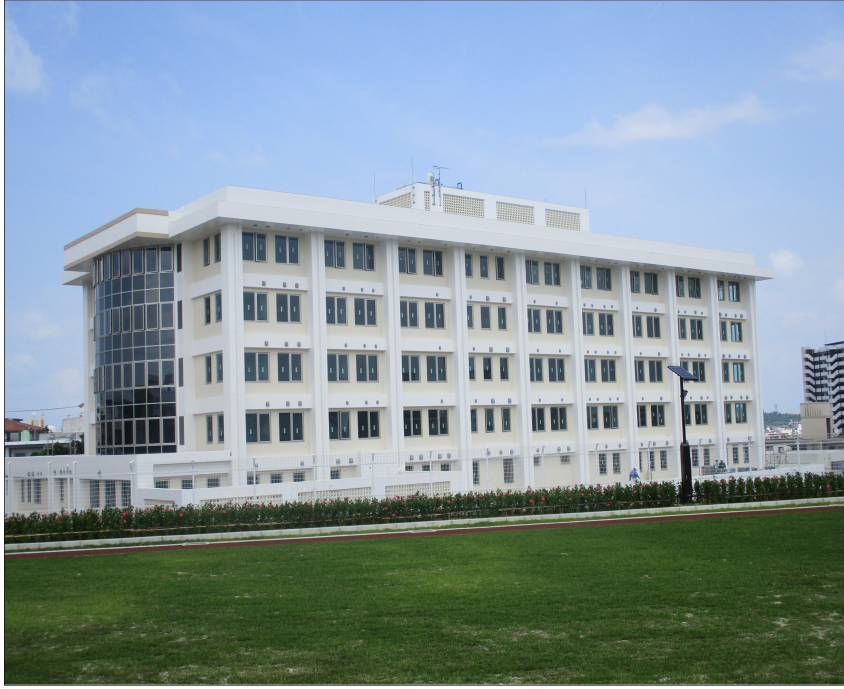
①全体（新吉原公園側から撮影）